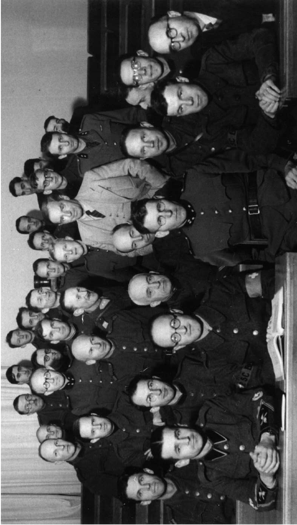
Fig. 1: Trinkwasser-Kurs des Geologischen Dienstes, Ende 1944.