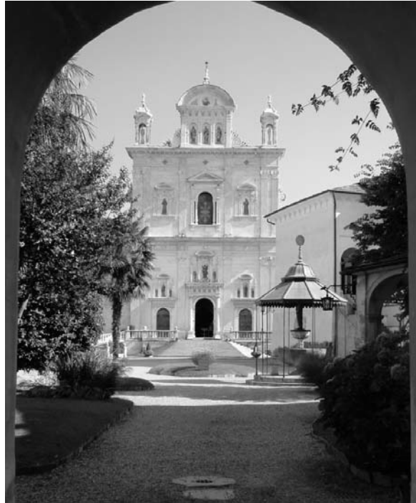
Fig. 2: «Sacro Monte», Varallo.

Das endgültige Tagungsprogramm und die Unterlagen zur Anmeldung werden auf der Web-Seite ( www.vsp-asp.ch ) bekannt gemacht.