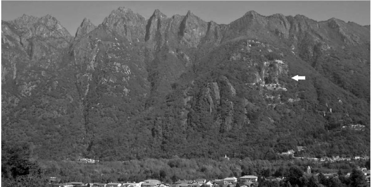
Fig. 3: Marmor-Steinbruch von Candoglia (Pfeil) | Marble Quarry of Candoglia (arrow).