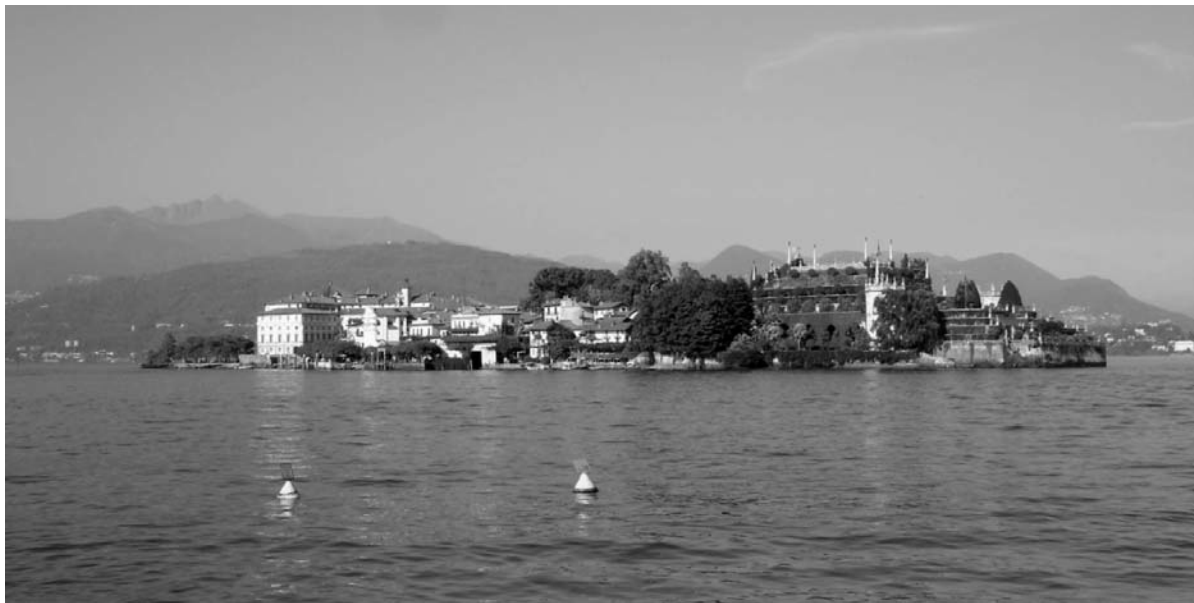
Fig. 1: «Isola Bella» bei Stresa, Lago Maggiore | «Isola Bella» near Stresa, Lago Maggiore.