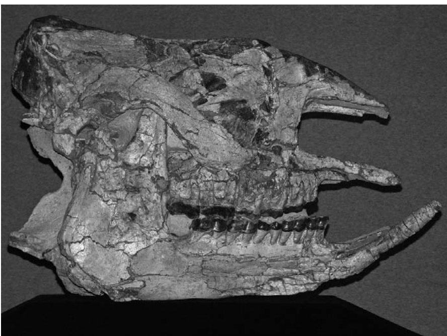
Fig. 1: Diaceratherium lemanense , Fund 1858, Neupräparation 2005. Objektbreite ca. 55 cm.

Das Projekt besteht aus dem Umbau des Autobahnanschlusses Neufeld, dem Neufeldtunnel, dem Knoten Tiefenaustrasse und der Umgestaltung des Knotens Henkerbrännli. Herzstück des zweispurigen Zubringers ist der 556 m lange Neufeldtunnel. Der