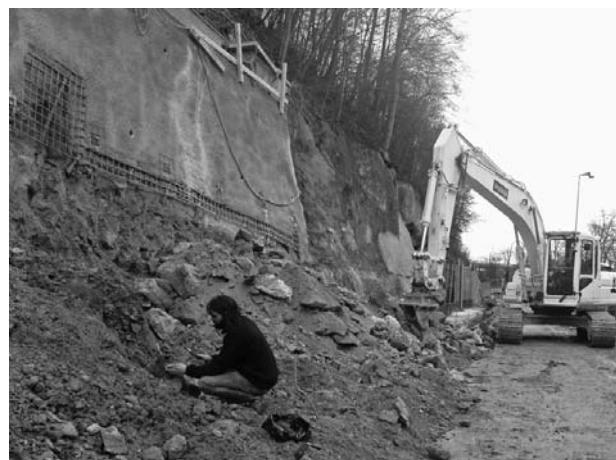
Fig. 2: Knochenfund in Linse, im Bereich Tiefenaustrasse, nördlich des zukünftigen Portals des Neufeldtunnels, am 8.3.2007.

Der Einschnitt des Neufeldtunnels brachte keine Fossilfunde. Dafür wurden im neuen, recht grossräumigen Aufschluss Sedimentstrukturen der USM sichtbar: Grosse Flussläufe, welche sich in die Schwemmebene eingeschnitten haben (Fig. 4): Die erosive Basis mit grobkörnigem Sediment (sog. lag) am Grund der Rinnen war deutlich zu erkennen (Fig. 5). Die USM wird hier von eiszeitlichen Lockergesteinen überlagert.