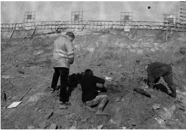
Fig. 3: Notgrabung im Bereich Tiefenaustrasse, nördlich des zukünftigen Portals des Neufeldtunnels, am 9.3.2007.