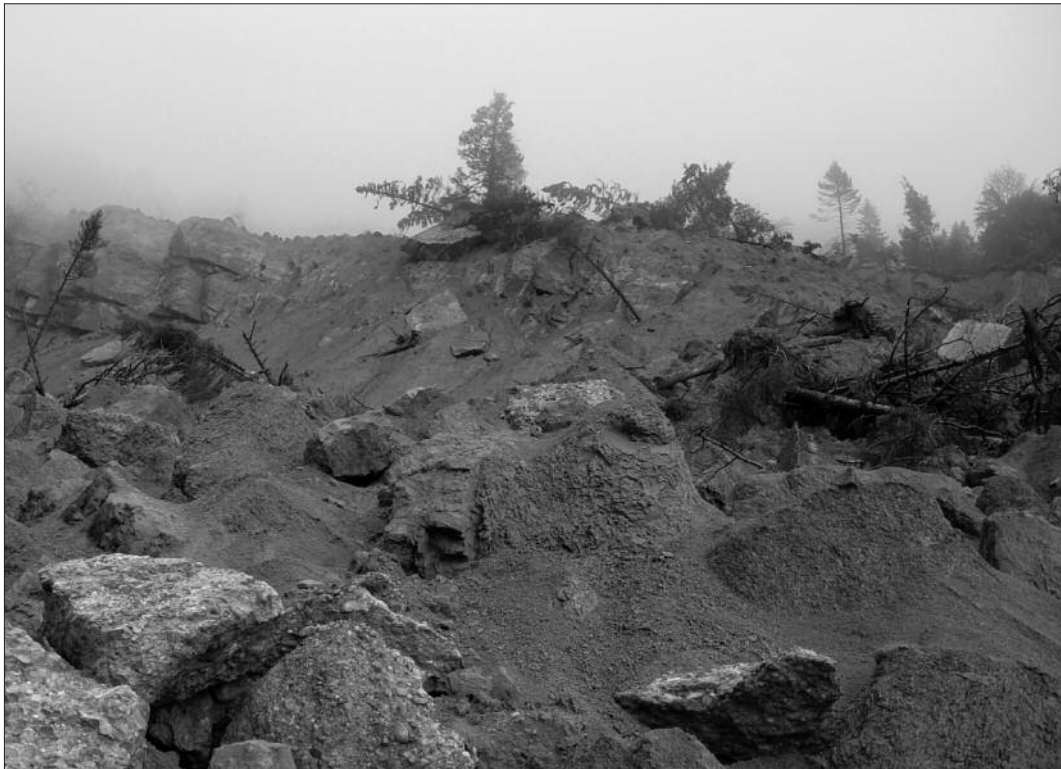
Fig. 2: Gribisch am Rossberg. Schuttmasse der Felsrutschung vom 22. August 2005. Ähnlich könnte es nach dem Bergsturz vom 2. September 1806 ausgesehen haben, allerdings um ein Vielfaches grösser.

Durch die Ablagerungen wurde die Landschaft nachhaltig verändert. Die Bachläufe wurden verschüttet, auf dem Schuttkegel bildeten sich verschiedene Tümpel, die ihrerseits eine Überflutungsgefahr darstellten. Für die Überlebenden einschneidend war auch der Verlust an Lebensgrundlagen. Dazu gehört der Boden, der im Raum Goldau